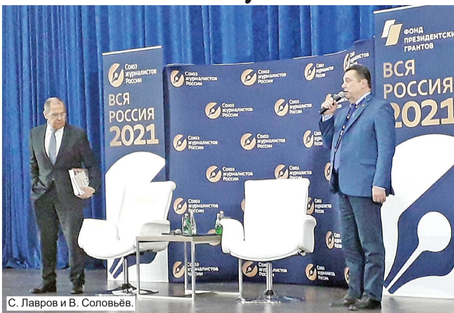
С. Лавров и В. Соловьёв.

Два дня назад отметили Международный день солидарности журналистов. Ваша профессия связана с высоким риском. В эти дни вспоминаем коллег, отдавших жизнь при исполне-